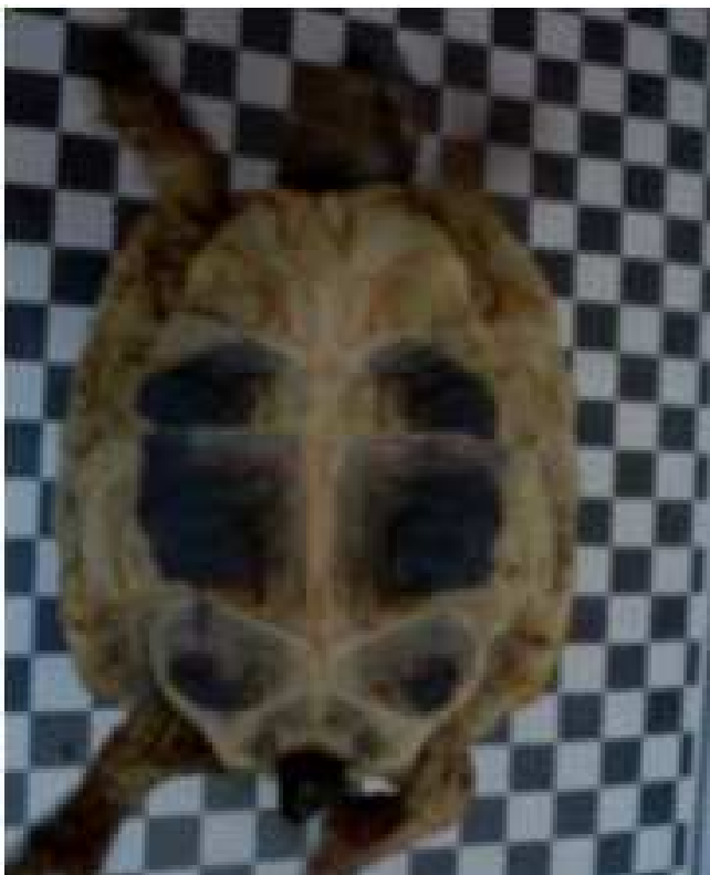
Foto ist zu dunkel und unscharf, die Nähte des Bauchpanzers sind nicht deutlich erkennbar.

Die Fotos sind unscharf und überbelichtet. Die Schildkröte ist nicht bildfüllend abgelichtet.